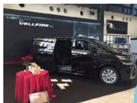
本店 高級感あふれるVFの展示は広いコースの中でも目を引きまます☆