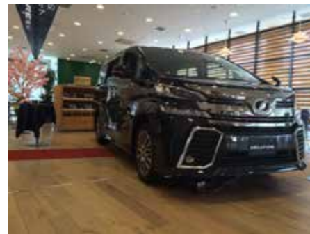
砺波店 桜と一緒に並んで春らしいですね*