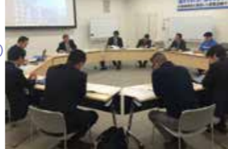
全員で活発な意見交換が行われました。