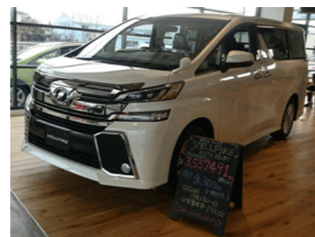
高岡西店 黒板に手書きでわかりやすくVFの紹介が書いてあります！