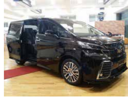
富山西店 店内に入っすぐにVFがお出迎え！