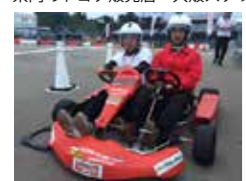
THE KART 二人乗りのラリー方式です！