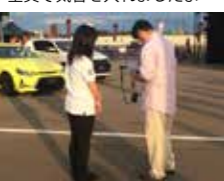
会場内ではタブレットを使ってアンケートを取っていました！