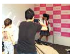
なりきり AKB コーナー！