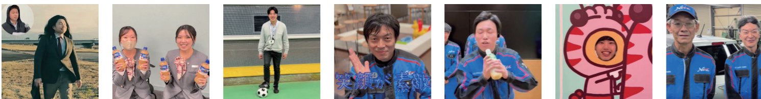
本店 U-CAR STATION 富山 富山南店 富山西店 高岡店 砺波店 魚津店 U-CAR 支援 G

ーサプライズ！各店舗スタッフからのビデオメッセージー 1年次卒業おめでとうございます。これからのさらなる成長とご活躍を期待しています！