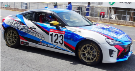
TOYOTA GAZOO Racing86/BRZ レース in ツインリンクもてぎ

4月1日～2日 TOYOTA GAZOO Racing86/BRZ レース (in ツインリンクもてぎ) が開催されました。昨年 8 6 のマイナーチェンジが行われ、よりパワーアップしラッピングデザインも青を基調に黒と赤のライン、金のミラーが光る新マシン #123 号と新ドライバー小松選手と共に臨んだシーズン開幕戦です！後期型のみ出場が認められたプロフェッショナルシリーズ決勝。気温・路面温度が予想以上に上昇しタイヤの負担が大きく難しいレースとなりましたが、結果は全 27 台中 20 位でフィニッシュ。レース直後にも関わらずエンジニアの高長君と小松選手がマシンの次回へのセッティングについて入念な打ち合わせ。すでに気持ちを次に向けての意気込みが感じられました。新たな NETZ TOYAMA Racing クラブの健闘を応援していきましょう！今後もレース結果を掲載していきます。