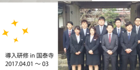
導入研修 in 国泰寺 2017.04.01 ~ 03