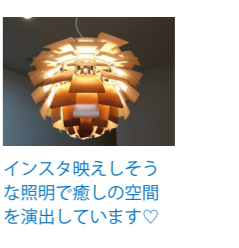
インスタ映えしそうな照明で癒しの空間を演出しています♡