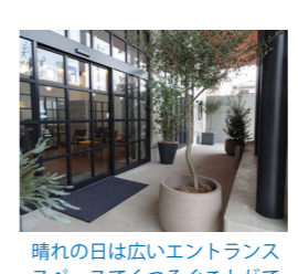
晴れの日には広いエントランススペースでくつろぐことができます。