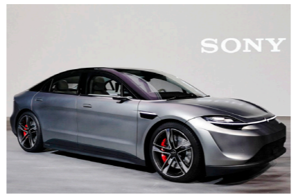
SONY 発表 電気自動車のコンセプトカー