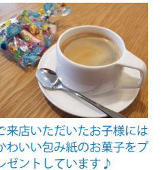
ご来店いただいたお客様にはかわいい包み紙のお菓子をプレゼントしています♪

店舗データ 店舗名：ネットトヨタ富山株式会社 U-CAR STATION 高岡 所在地：高岡市新成町 3-25 社員数：8 名（男性 7 名 / 女性 1 名） 呉西地区の U-CAR の拠点として、若い世代にも気軽に来店してもらえお洒落な店内。天井が高く開放感のある店内には、北欧デザインのインテリアや「KooNeI（クーネ）」による音響なども備わり、リラックス出来る雰囲気。