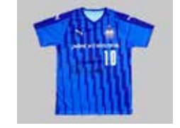
■ 富山第一高校 サッカー部

スタッフもランナーとしての出場やボランティアスタッフとして大会を応援しています。