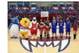
■ 富山グラウジーズ

ショールーム内に人工芝が敷かれたサッカー場で行われるキッズフットサル大会『ネットフレンズリーカップ』にカターレ選手に参加していただきました。