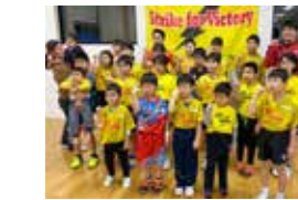
■ ST ライトニング

富山市を本拠地とし、日本フットボールリーグ入りを目指す社会人サッカークラブです。ピッチボード広告を出稿させていただきました。