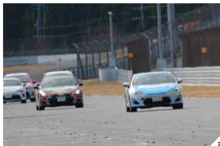
Photo 1. スタート前の記念撮影をする86チーム / Photo 2. 接戦を繰り広げる86 / Photo 3. スタート前にアミーを囲んで円陣を組むチーム / Photo 4. 86/BRZクラスの表彰式

終盤、上位は5チーム程が上位争いとなり、お互いの燃料の余力が分からない状況で、いつスパートをかけるかの探り合いを行います。ネット富山は序盤と変わらない燃費とタイムをキープし、終盤ついにトップへ立ちました。念願の優勝を勝ち取ることができ、チームは歓喜に包まれました。