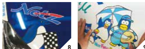
ネット福井チームのVitzにもペンギンのキャラクターが描かれており、何か運命を感じさせられました。