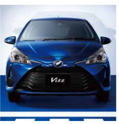
Vitz特別仕様車 1.0F "Safety Edition" (2WD) 車両本体価格 ¥1,384,560

スタイルと快適さにこだわりながら、頼れる安心をプラスした特別仕様。先進の安全機能「Toyota Safety Sense C」が、毎日のドライブをサポート。