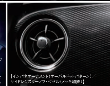
【インパネオーナメント(オーバルドットパターン) / サイドレジスターノブ・ベゼル(メッキ加飾)】