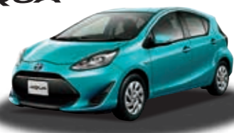
アクア S (1.5L 2WD) ***** ¥1,886,760