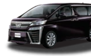
ヴェルファイア Z (2.5L 2WD 7人乗り) ***** ¥3,757,320