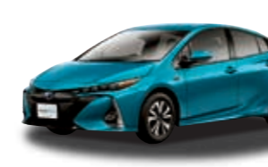
プリウスPHV 特別仕様車 S "Safety Plus" (1.8L 2WD) ***** ¥3,325,320