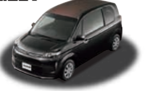
スパイド 特別仕様車 F "Noble collection" (1.5L 2WD) ***** ¥1,730,160