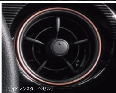
【サイドレジスターベゼル】