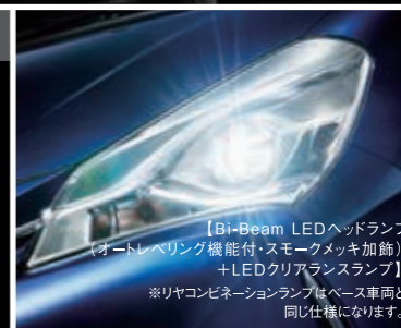
【Bi-Beam LEDヘッドランプ (オートレベリング機能付・スモークメッキ加飾) +LEDクリアランスランプ】 ※リヤコンビネーションランプはベース車両と 同じ仕様になります。

Photo:特別仕様車HYBRID F"Safety Edition III"【ベース車両はHYBRID F】。内装色はブラック。フロアマット(特別仕様車用)<16,200円>は販売店装着オプション。ナビゲーションシステム(T-Connectナビ9インチモデル、ステアリングスイッチ無車<145,800円【取付費が別途必要】>)は販売店装着オプション。