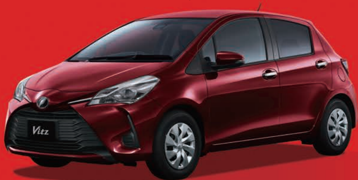
Vitz 特別仕様車 1.3F "Amie"