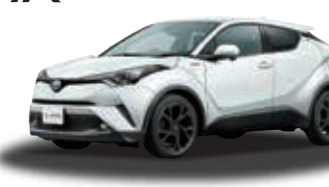
C-HR G "Mode-Nero" (1.8L 2WD) ***** ¥2,979,200

●本紙に掲載している車両の価格はスペアタイヤもしくはバンク修理キット、タイヤ交換工具付きの価格です。●価格にはオプションの価格は含まれていません。●保険料、税金(除く消費税)、登録料などの諸費用は別途申し受けます。●自動車リサイクル法の施行により、リサイクル