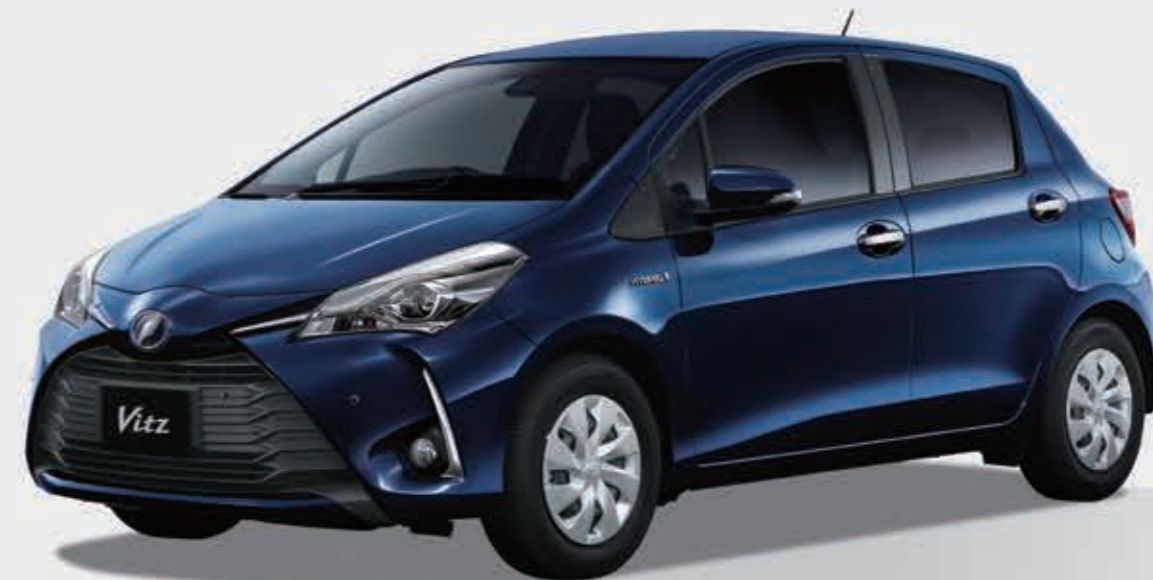
Vitz 特別仕様車 HYBRID F "Safety Edition III" DEBUT