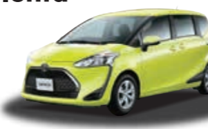
シエンタ G (1.5L 2WD) ***** ¥2,380,320