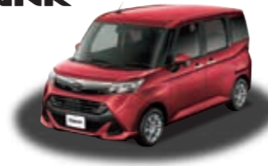
タンク 特別仕様車 G "Cozy Edition" (1.0L 2WD) ***** ¥1,979,640