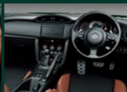
グランリュクス®巻き