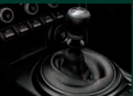
キャストブラック塗装