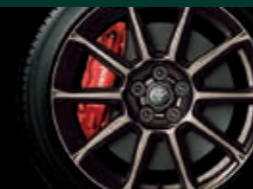
17インチ専用アルミホイール